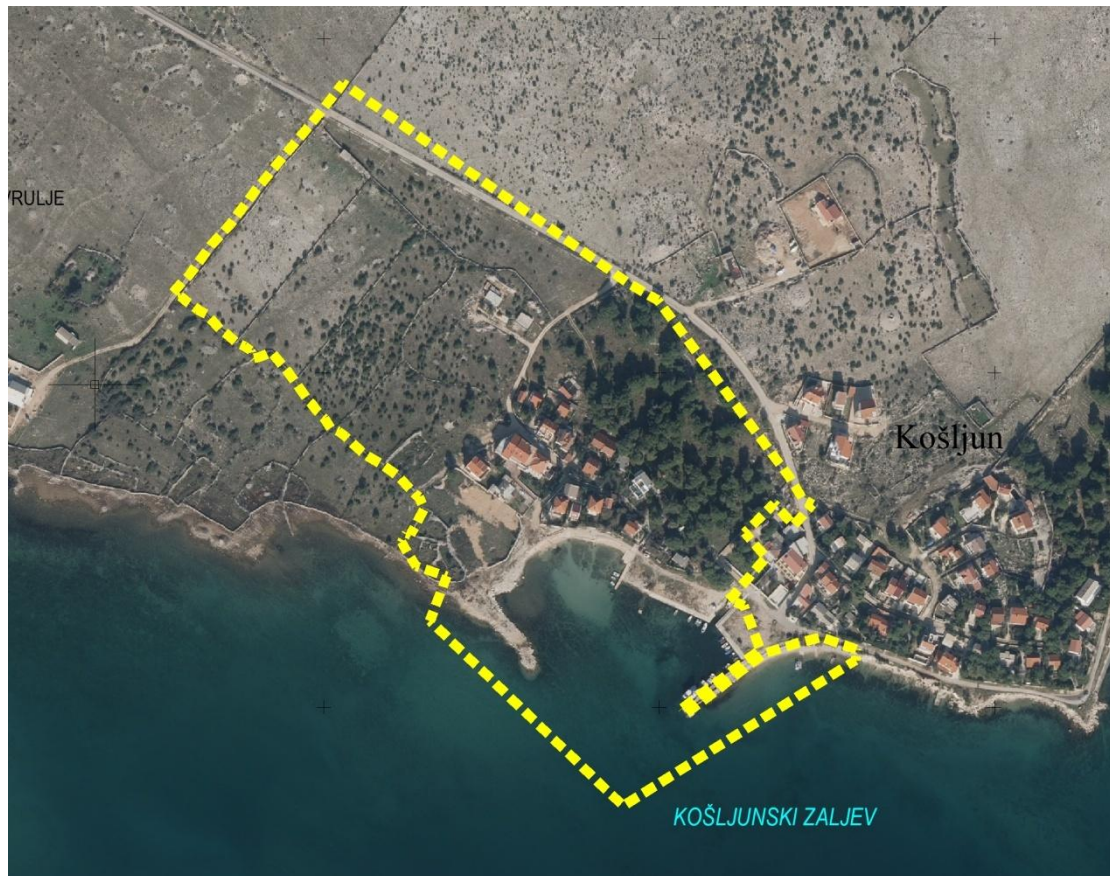
ObuhvatPlana prikazan na digitalnom ortofoto snimku