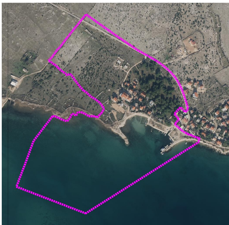
Obuhvat Plana prikazan na digitalnom ortofoto snimke